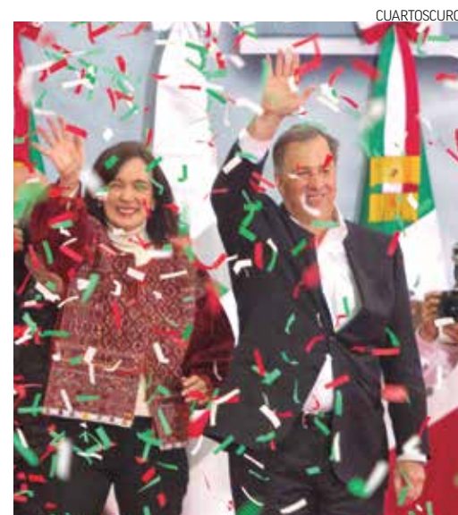
Y QUEDÓ REGISTRADO. José Antonio Meade pidió a los priistas su apoyo para ganar las elecciones de 2018.

GASOLINEROS / PÁG. 10 INVERTIRÁN 2 MIL MILLONES DE DÓLARES EN 40 TERMINALES DE ALMACENAMIENTO.