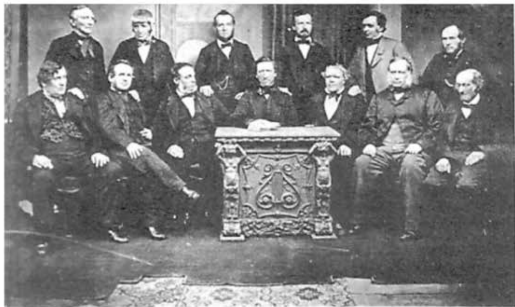
PHOTOGRAPH OF THIRTEEN OF THE ORIGINAL MEMBERS OF THE ROCHDALE EQUITABLE PIONEERS' SOCIETY.

La Cooperativa trabaja para el desarrollo sostenible de su comunidad por medio de políticas aceptadas por sus miembros.